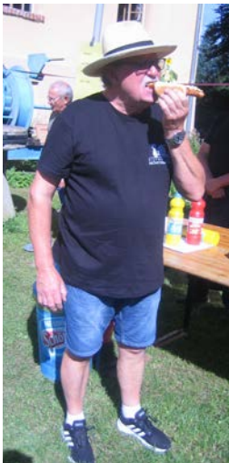
Vater und Sohn Hecht